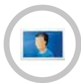
ALTA QUALITÀ VIDEO

La videocomunicazione alla portata di tutti. La qualità dell'alta definizione e la convenienza della webconference