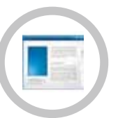
INTERFACCIA UTENTE INTUITIVA E PERSONALIZZABILE