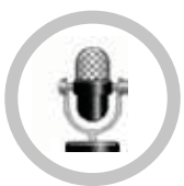
ALTA QUALITÀ AUDIO